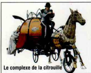
Le complexe de la citrouille