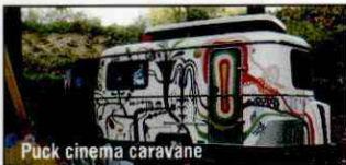
Puck cinema caravane

12:00 h. CIR&CO Tradicional. Barraca. Cine. Juegos. Plaza Catedral "Puck cinema caravane". "Colors monster". TOMBS CREATIUS (ESPAÑA).