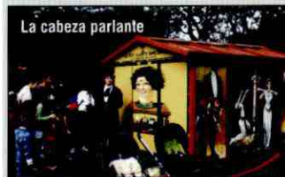
La cabeza parlante

12:00 h. CIR&CO Tradicional. Barraca. Cine. Juegos. Plaza Catedral "Puck cinema caravane". "Colors monster". TOMBS CREATIUS (ESPAÑA).